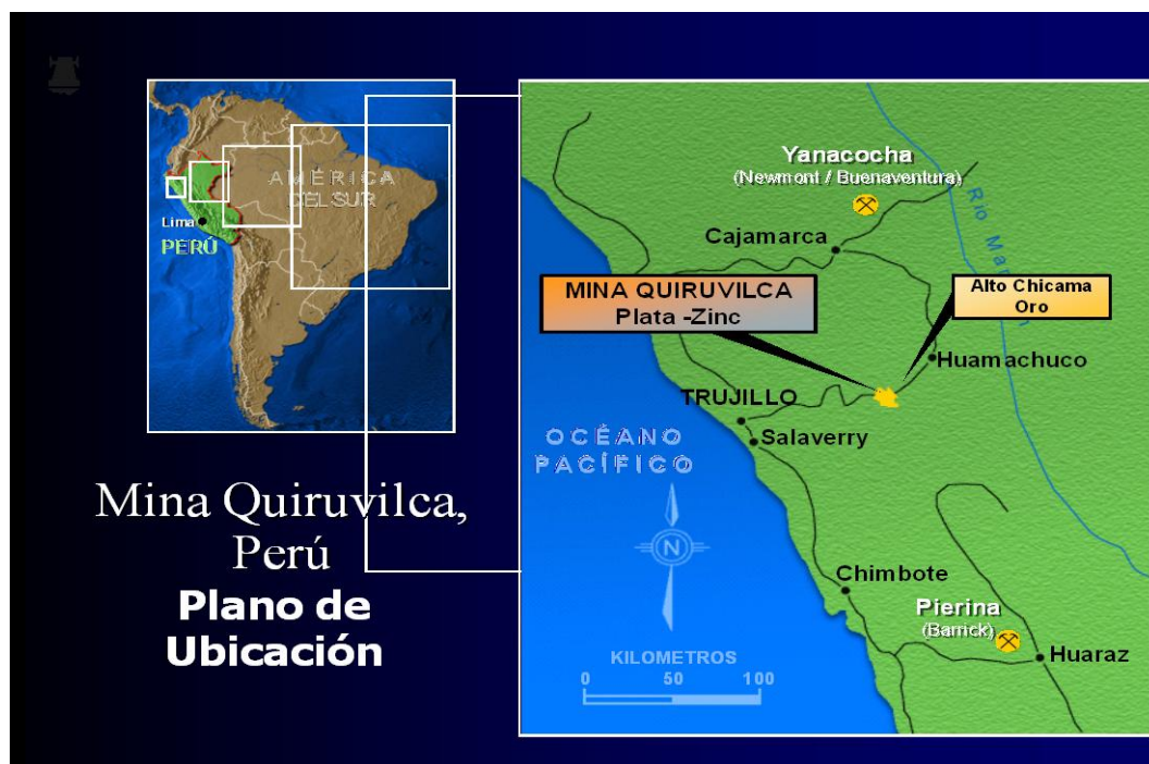
Figura 1. Plano de ubicación del área de estudio de la cuenca del río Moche, Perú desde el asiento minero ubicado en la localidad de Quiruvilca, hasta su desembocadura en el océano Pacífico (Gráfico tomado de Compañía Minera Panamericana, 2006).